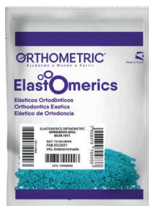
Embalagem com 1000 unid.